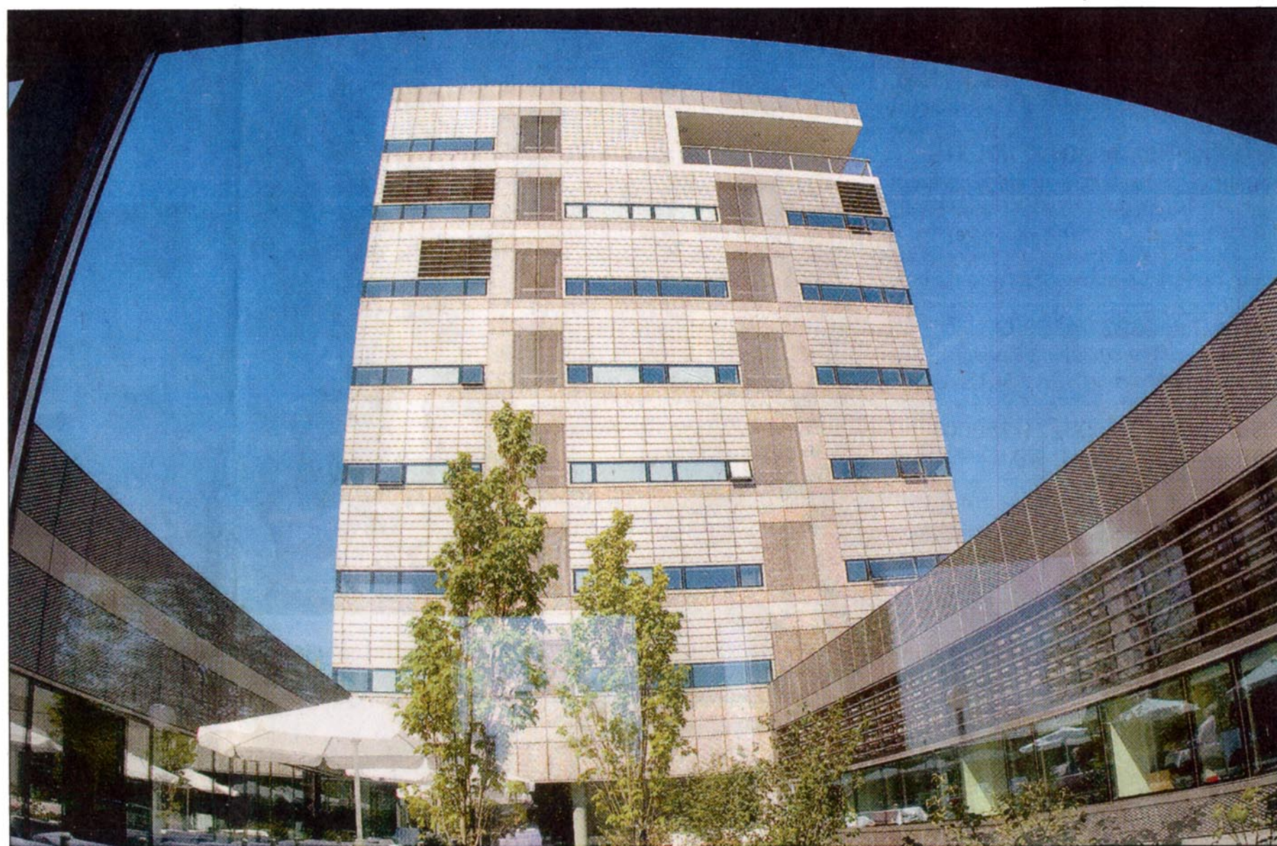
Das neue Bioquant-Gebäude im Neuenheimer Feld bietet rund 350 Wissenschaftlern nicht nur hervorragende Arbeitsbedingungen, es ist auch architektonisch eine gelungene Mischung aus Funktionalität und Ästhetik.

Rund 350 Wissenschaftler werden sich in Labors und Büros der „quant“-itativ Analyse molekularer und zellulärer „Bio“-systeme widmen – daher der Na-